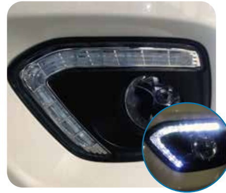
Luz día LED (DRL) y exploradora halógena con amplio haz de luz la cual permite una conducción más segura.