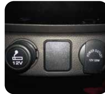
Encendedor de cigarrillo y toma de poder adicional de 12V.