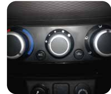
Aire acondicionado análogo.